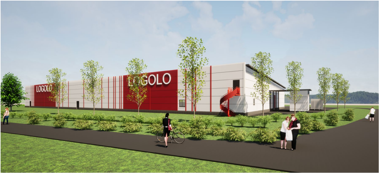
LUONNOS KAAKOSTA / HÄMEENLINNANTIETÄ